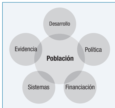
Figura 3. La red interactiva de lecciones para mejorar la equidad, la gobernanza y los sistemas de salud.

El presente libro ha presentado evidencia generada durante casi 15 años sobre maneras para mejorar la equidad, la gobernanza y los sistemas de salud, a fin de que sean más efectivos para grupos vulnerables, como las mujeres, los niños y los adolescentes. Asimismo, hemos sintetizado lecciones que surgen de la investigación y la experiencia respaldadas a nivel internacional (véase la Figura 3) a fin de poder informar e inspirar a una nueva generación de líderes e investigadores de la salud, a la vez que compartimos algunas reflexiones críticas sobre los desafíos que faltan abordar con otros miembros de la comunidad sanitaria internacional, incluidas organizaciones de financiación.