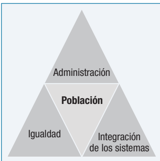
Figura 2. Enfoque de programación de salud del IDRC: los tres principios eficaces

Las personas (usuarios, proveedores, dirigentes) están en el centro de los tres principios transversales. Cada principio da forma y es formado por las partes interesadas en el sistema de la salud, quienes comparten responsabilidades para garantizar la provisión de servicios accesibles de calidad. La gobernanza les permite a los ciudadanos establecer prioridades y exige la rendición de cuentas de las instituciones y de los dirigentes por sus funciones y deberes. La igualdad revela quiénes son los vulnerables en una sociedad y resalta el papel que tienen los ciudadanos, las instituciones y los dirigentes en la labor por lograr una distribución justa de los recursos. Los sistemas de salud incluyen a los trabajadores y los dirigentes responsables de la prestación de servicios, así como a los usuarios y los defensores que exigen y utilizan estos servicios.